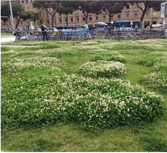
ESŐKERT a pumpapálya középső területein a keletkező víz elszikkasztására