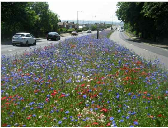
fűmagvetés virágmagok elszórásával