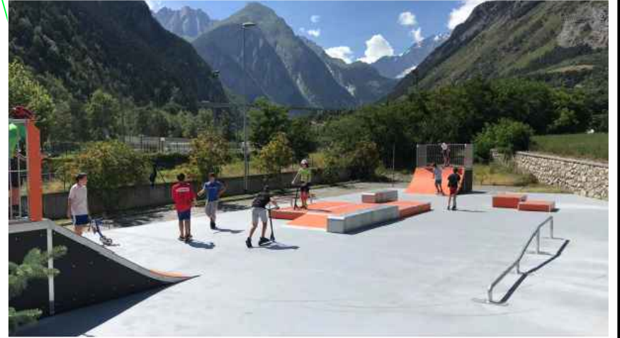
gördeszkáelemek betonfelületen elhelyezve